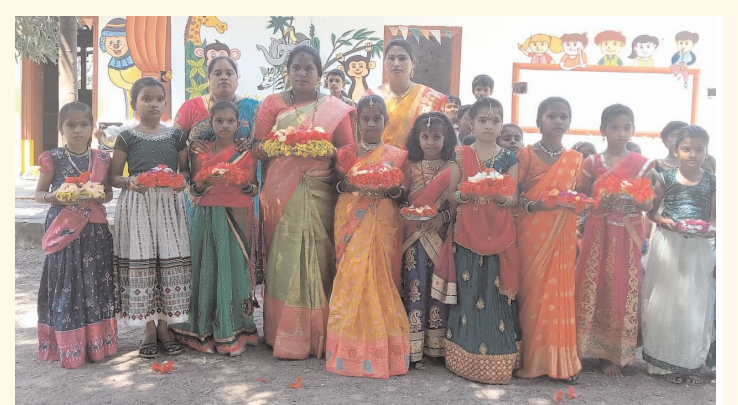
మీ వార్త పరకాల ప్రతినిధి