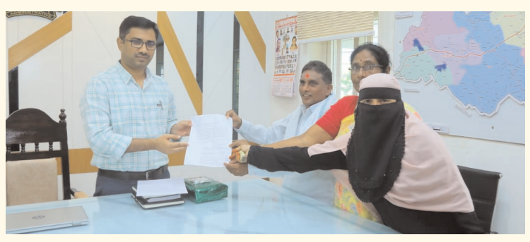
జయశంకర్ భూపాలపల్లి జిల్లా అక్టోబర్ 01 మీవార్

ములుగు జిల్లాలోని అర్జున నిరుపేదలకు ఇందిరమ్మ ఇండ్లు మంజూరు చేయాలని వినతి పత్రం అందజేసారు అనంతరం ముంజల బిక్షపతి గౌడ్ మాట్లాడుతూ అర్జున నిరుపేదలకు ఇందిరమ్మ ఇండ్లు ఇవ్వాలని బిక్షపతి అన్నారు ములుగు పట్టణంలో నిరుపేదలు 30 సంవత్సరాల నుండి కిరాయి ఇంటిలో నివసిస్తున్నారని కనీసం ఇంటి కిరాయి కట్టే పరిస్థితులు లేరు కనీసం ఉండడానికి గూడు కావాలి అని వారన్నారు గత ప్రభుత్వం ములుగు పట్టణంలో 10 సంవత్సరాల క్రితం 100 ఇండ్లు మంజూరు చేసినా గతంలోనే టిఆర్ఎస్ ప్రభుత్వంలో ఉన్నప్పుడు డబుల్ బెడ్ రూమ్ ఇండ్ల కోసం పెద్ద ఎత్తున ఉద్యమాలు నిర్వహించినా అయినా టిఆర్ఎస్ ప్రభుత్వం ఇండ్లు ఇవ్వలేదు ఇప్పటివరకు అధికారులు చెబుతున్న ప్రకారం 35 ఇండ్లు పూర్తి అయినా గతంలో అన్నారు 10 సంవత్సరాల నుండి 100 ఇండ్లు కూడా పూర్తి చేయలేదు ఇది పరిస్థితి ఈ ప్రభుత్వమైన అర్జున నిరుపేదలకు ఇందిరమ్మ ఇండ్లు ఇవ్వాలని ముంజల బిక్షపతి గౌడ్ పూర్వం 35 ఇండ్లు అర్జున నిరుపేదలకు ఇవ్వాలని జిల్లా కలెక్టర్కు వినతి పత్రం అందజేసామని వారు తెలిపారు వారి వెంట తదితరులు పాల్గొన్నారు రూపాన్ని మునిసి డేగం