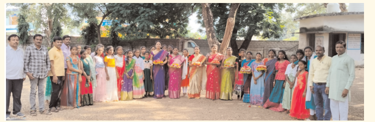
చిట్టాల అక్టోబరు 01 (మీవార్)