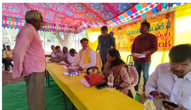
ఎమ్మెల్యే సొంగ. రోషన్ కుమార్.....

చింతలపూడి ఏప్రిల్ 2 ( మీ వార్డు జిల్లా బ్యూరో ): గ్రామాల్లో ప్రజలు ఎదుర్కొంటున్న సమస్యల పరిష్కారమే ప్రజా వేదిక లక్ష్యమని చింతలపూడి ఎమ్మెల్యే సొంగ. రోషన్ కుమార్ అన్నారు. బుధవారం చింతలపూడి పట్టణంలోని ఆర్ఆండ్వీ ఆతిథి గృహంలో ప్రజా సమస్యల పరిష్కార వేదిక గ్రీవెన్స్ కార్యక్రమాన్ని నిర్వహించారు.