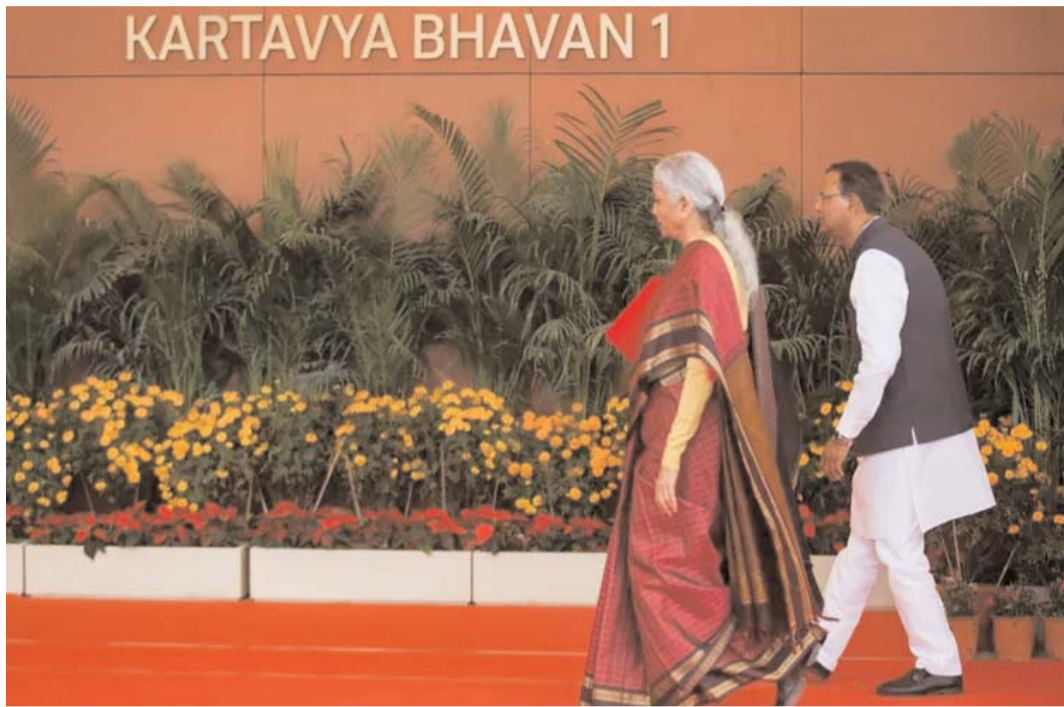
పుంజుకోవడం లేదు. పశ్చిమాసియా సంక్షోభం వల్ల తదితర సవాళ్లు వీడికి తోడయ్యాయి. ఈ నేపథ్యంలోనే ఆర్థిక రూపాయి బలహీనపడటం, క్రూరదాలో రేట్లు పెరగడం శాఖ కసరత్తు ప్రాధాన్యం సంతరించుకుంది.

న్యూఢిల్లీ: ఆర్థిక విధానాలు.. బడ్జెట్ ప్రతిపాదనల రూపకల్పనకు, పశ్చిమాసియా సంక్షోభంపరమైన సవాళ్లను ఎదుర్కొనేందుకు తీసుకోవలసిన చర్యల గురించి క్షేత్రస్థాయిలో సమాచారాన్ని సేకరించేందుకు కేంద్ర ప్రభుత్వం సిద్ధమైంది. ఇందుకోసం దేశవ్యాప్తంగా ఫ్యాక్టరీలు, పరిశ్రమ క్షుద్ధను సందర్శించడంపై కేంద్ర ఆర్థిక శాఖలో భాగమైన ఆర్థిక వ్యవహారాల విభాగం కసరత్తు ప్రారంభించినట్లు తెలుస్తోంది. దీని ప్రకారం ఆర్థిక శాఖలోని అదనపు కార్యదర్శి, సంయుక్త కార్యదర్శి లేదా డైరెక్టర్ సారథ్యంలో అయిదుగురు వరకు సభ్యులతో బృందాలు ఏర్పాటు చేస్తారు. ఈ బృందాలు భారీ, మధ్య, చిన్న తరహా తయారీ యూనిట్లను సందర్శిస్తాయి. వివిధ రంగాల వ్యాప్తంగా విధానాలు, నిర్వహణపరమైన సవాళ్లను పరిశీలిస్తాయి. మౌలిక సదుపాయాలు, రెగ్యులేటరీ అవరోధాలు, సరఫరా వ్యవస్థలో అవాంతరాలు, నిధుల లభ్యతపరమైన సవాళ్లు, నైపుణ్యాల్లో కొరత, సాంకేతికత వినియోగం మొదలైన అంశాలు వ్యాపారాలపై చూపుతున్న ప్రభావాల గురించి నేరుగా తెలుసుకుంటాయి. ఒక్కో విడతలో కనీసం రెండు స్టార్ట్అప్ తో పాటు తయారీ, ఇన్ఫ్రా, పరిశోధనలు తదితర రంగాల సంస్థలను సందర్శించి, పరిస్థితుల గురించి బృంద సభ్యులు తెలుసుకుంటారు. కొన్ని రంగాలపై ప్రభుత్వం గణనీయంగా వ్యయం చేస్తున్నప్పటికీ, వివిధ కారణాలతో వైబెల్ పెట్టుబడులు ఇంకా