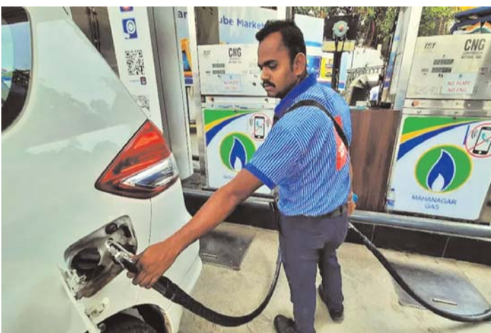
ప్రత్యామ్నాయంగానే కొనసాగుతోంది. ఇదే సమయంలో షెల్, డీజిల్ ధరలు కూడా పెరుగుతున్నాయి. ప్రస్తుతం ముంబైలో లీటర్ షెల్ ధర రూ.111.21గా, డీజిల్ ధర రూ.97.83గా నమోదైంది. దీంతో రవాణా రంగంపై ఇంధన వ్యయాల భారం మరింత పెరిగే అవకాశం కనిపిస్తోంది.

ప్రయోజనాలు అందించే మార్గాలను అన్వేషిస్తున్నట్లు సంస్థ తెలిపింది. ఇటీవలి కాలంలో సీఎన్జీ ధరలు పెరగడం ఇది రెండోసారి. గత మే 14న కూడా ఎంజిఎల్ కిలోకు రూ.2 చొప్పున ధరలను పెంచింది. తాజా పెంపుతో ఆటోరిక్షాలు, ట్యూక్సీలు, బస్సులు సహా సీఎన్జీ ఆధారిత రవాణా సేవల నిర్వహణ వ్యయాలు మరింత పెరగనున్నాయి. ముంబై, థానే, నవీ ముంబైతో పాటు ఎంఎంఆర్లోని ఇతర ప్రాంతాల్లో ఈ ధరల పెంపు అమలులోకి వచ్చింది. ఎంజిఎల్ గ్యాస్ సరఫరా నెట్వర్క్ కళ్యాణ్, రాయ్గే, రత్నగిరి, లాతూర్, ఉస్మానాబాద్, చిత్రదుర్గ, దావణగెరి వంటి ప్రాంతాలకు కూడా విస్తరించి ఉంది. షెల్, డీజిల్తో పోలిస్తే ఇంకా చౌక ధరలు పెరిగినా కిలోమీటరుకు అయ్యే నిర్వహణ వ్యయ పరంగా సీఎన్జీ ఇప్పటికీ షెల్, డీజిల్తో పోలిస్తే చౌకైన